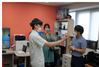
<기업방문 현장 점검>